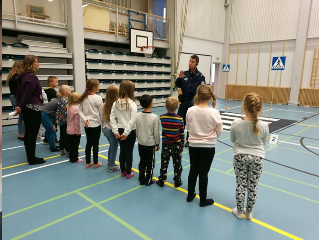
Turvaa tenaville -tapahtuma