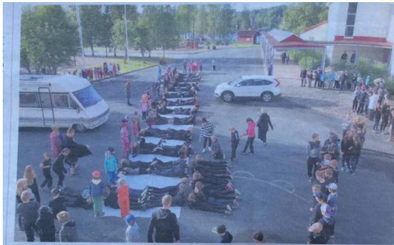
SALMELÄN koululla Sotkamossa huomioitiin näyttävästi turvallisuusviikon teemat. Kuva tiistailta, jolloin koulun pihalle muodostettiin oppilaita silvää suojatietä.