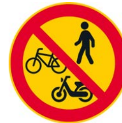
Jalankulku sekä polkupyörällä ja mopolla ajo kielletty