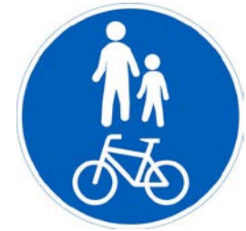
Yhdistetty pyörätie ja jalkakäytävä