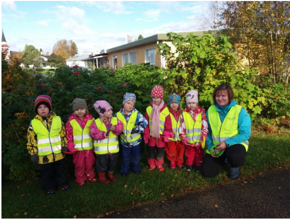
Peukaloisen päiväkotä toteutti Sinä teet suojatien -kampanjaa