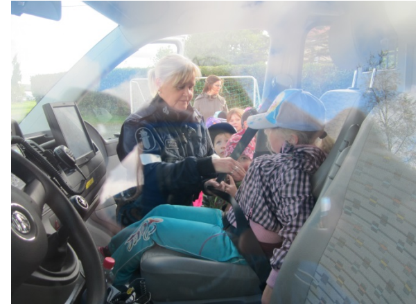
Alavieskan 1.-2.-luokkalaiset osallistuivat Turvaa tenaville –tapahtumaan Juhon Oksan koululla.