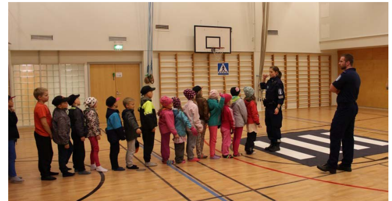
Turvaa tenaville –tapahtumassa harjoiteltiin mm. tien ylitystä.