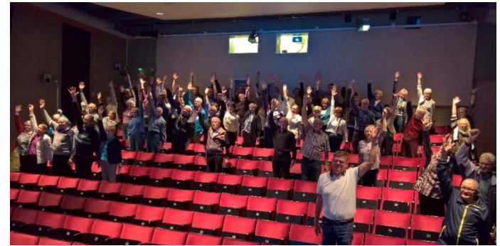
Pyhäjärven eläkeläisiä osallistui Ajoterveyden vaaliminen –luentotilaisuuteen 15.9. Haapajärvellä.