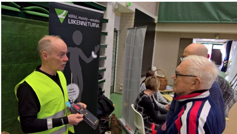
Liikenneturvan kouluttaja Haapajärven hyvinvointi- ja teknologiamessuilla