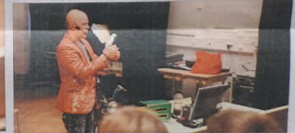
Mopotarinoiden lomassa Puijon Paroni teki taikatemppuja. Avustajana hänellä oli Mimi-kyyhky.