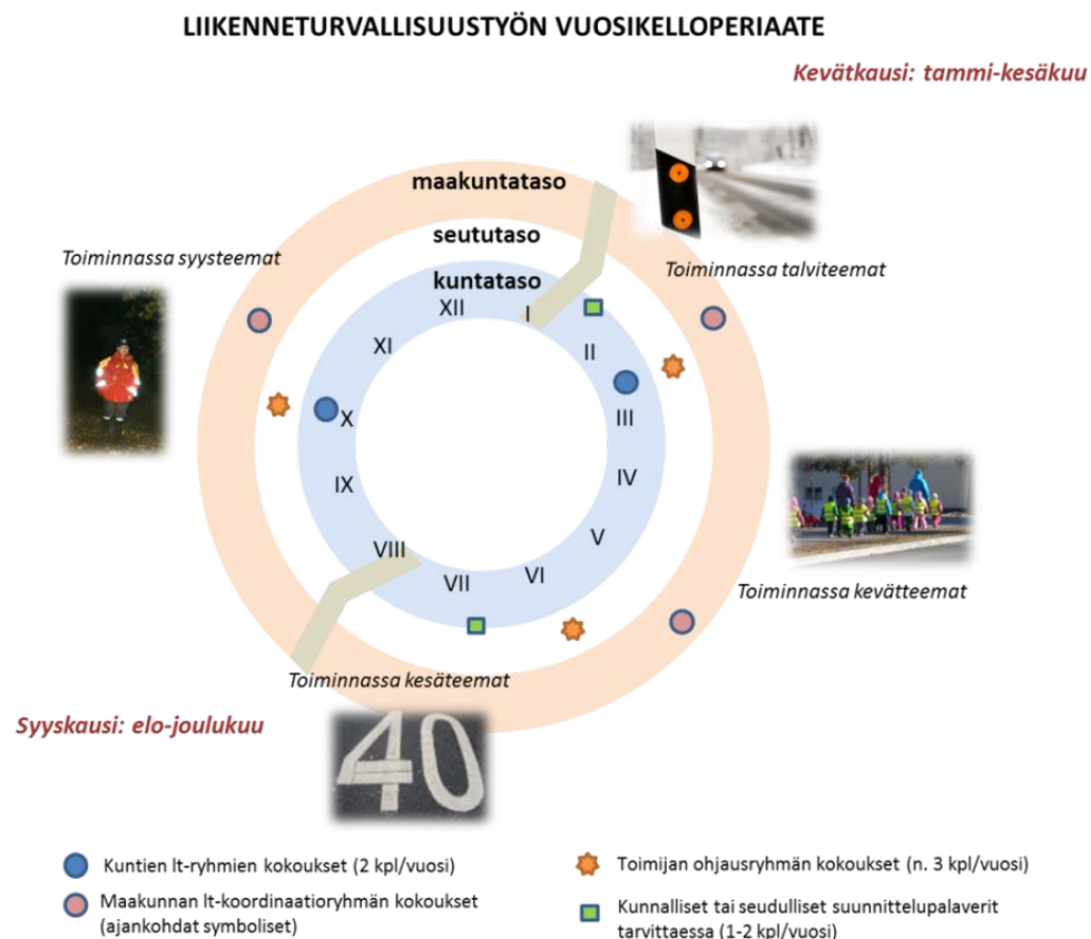
Kuva 1. Nivala-Haapajärven seudun liikenneturvallisuuustyön ohjeellinen vuosikello.

Liikenneturvallisuuustyön perustan muodostaa kunnissa tehtävä paikallinen työ, jota koordinoidaan kuntien liikenneturvallisuuusryhmissä. Toimijan keskeisin tehtävä on kuntien liikenneturvallisuuustyön tukeminen ja toimija osallistuu tiiviisti mm. liikenneturvallisuuusryhmien toimintaan. Tärkeää on, että kunnat oppivat hyödyntämään toimijaa. Työn pohjan luo kuntaryhmien säännöllinen toiminta ja hyvä yhteistyöverkosto. Seudun yhteiset toimintalinjaukset tehdään seudullisessa liikenneturvallisuuustyön ohjausryhmässä, jossa on edustajat kaikista kunnista sekä yhteistyötahoista. Ryhmä ohjaa myös liikenneturvallisuuustoimijan työtä. Toimija toimii tiedonvälittäjänä ja liikenneturvallisuuustyön tukena sekä seutu- että kuntatasolla ja osallistuu aktiivisesti työn suunnitteluun ja kehittämiseen. Liikenneturvallisuuustyö rytmittyy Nivala-Haapajärven seudulla alla olevan vuosikellon mukaisesti (kuva).