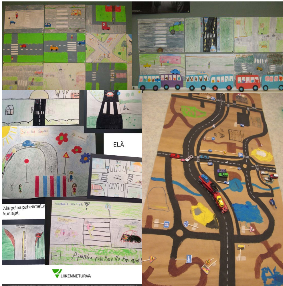
Sinä teet suojatien –kampanjan suojatieaiheista piirustuksia ja askarteluja